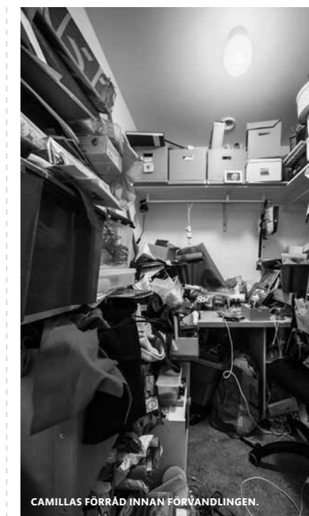
CAMILLAS FÖRRÅD INNAN FÖRVANDLINGEN.

– Det skulle i så fall vara min BigShot. Det är en liten maskin som man både kan skära och stansa ut olika figurer i papper med. Den är fantastisk till att göra olika typer av gratulationskort och inbjudningskort, samt en bra kniv att skära större papper med.