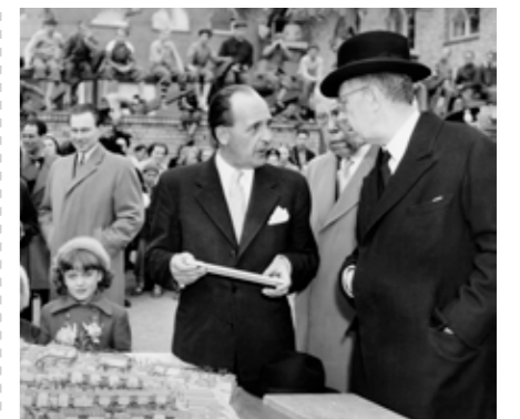
KUNGEN INVIGER OMRÅDET 1951.

I källaren på ett av boningshusen finns en sal som kallas Tunasalen. När den byggdes kunde man använda den som samlingsplats för fester och spex eftersom det längst in byggts en rund scen. På väggarna sitter det ribbor som skruvats upp för hand för att dämpa ljudet. Idag används inte salen lika flitigt som förr men det är fortfarande