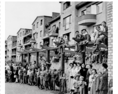
MÅNGA BARNFAMILJER FLYTTADE TILL TUNA BACKAR.

en samlingsplats samtidigt som det idag huserar en liten områdesloppis.