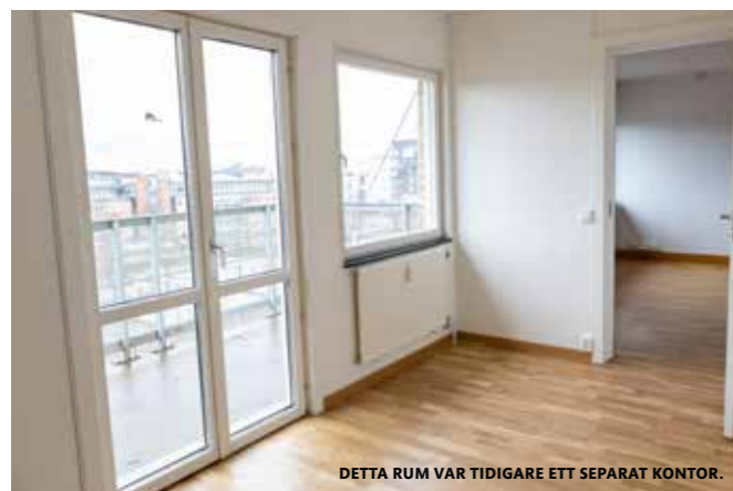
DETTA RUM VAR TIDIGARE ETT SEPARAT KONTOR.

att lägenheterna som förut var på drygt 20 kvm fått ett helt nytt sovrum och en balkong. I samma byggnad på entréplan har vi även gjort om två gamla kontor till bostäder så fler får chansen att bo här. Vi hoppas att de kommande hyresgästerna kommer bli nöjda med resultatet och att de kommer trivas!