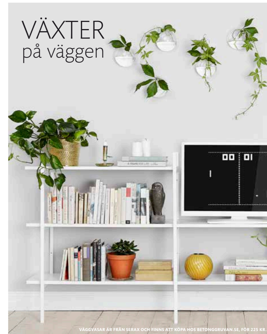
VÄGGVASAR ÄR FRÅN SERAX OCH FINNS ATT KÖPA HOS BETONGGRUVAN.SE, FÖR 225 KR.

Med åren behöver tapeter, golv och kök bytas ut i våra hem och på så sätt kan husen leva länge, längre än oss! För att du ska få det precis som du vill ha det hemma när det är dags att renovera, finns Bobutiken som en viktig länk mellan dig, hantverkarna och Uppsalahem.