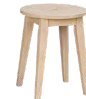
Metro pall i vitlaserad ek 44 cm hög, Ellos home.

TIPS! Välj en golvlampa om du vill slippa montera lampan på väggen!