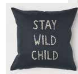
Kuddfodral, HM home