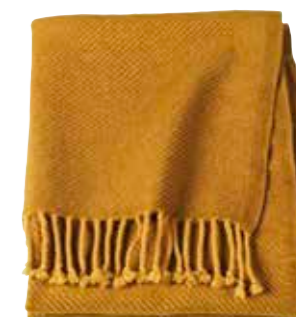
Pläd Omtänksam, IKEA