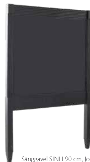
Sänggavel SINLI 90 cm, Jotex