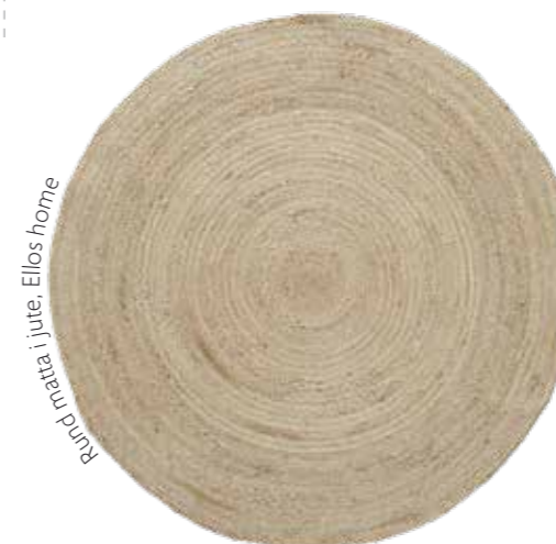
Rund matta i jute, Ellos home