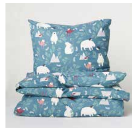
Påslakanset, HM home

vägg eller sänggavel. Tänk ur barnets perspektiv – sätt upp hyllor och krokare i barnens höjd så att de själva kan använda dem. Sist men inte minst – skapa mycket förvaring! Smart förvaring är A och O.